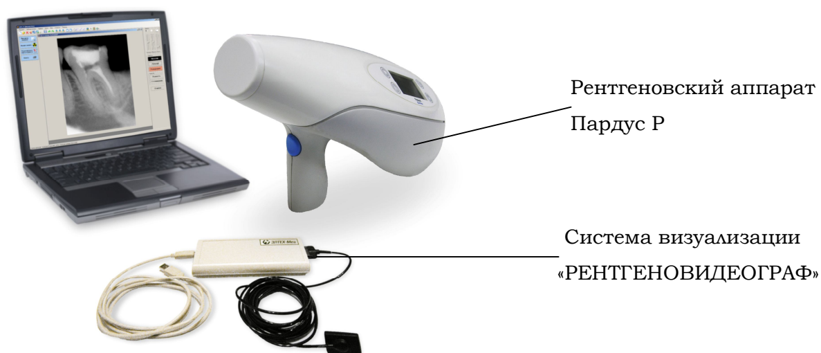
Рис. 1: Внешний вид портативного цифрового рентгенодиагностического комплекса «ПАРДУС-Стома»

Рентгенодиагностический комплекс «ПАРДУС-Стома» состоит из портативного микрофокусного рентгеновского аппарата «ПАРДУС-Р» и цифрового устройства для визуализации рентгеновского изображения «РЕНТГЕНОВИДЕОГРАФ» (рис. 1).